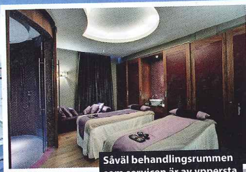
Såväl behandlingsrummen som servicen är av yppersta kvalitet på Espa Riga.

TVAGNING I TOPPKLASS I denna pool, belägen på taket på en elegant och omsorgsfullt renoverad jugendbyggnad, kommer du inte att kunna låta bli att njuta av livet. Det femstjärniga och internationella spakonceptet Espa har sin nordligaste filial i Riga och breder ut sig på hela sex våningar med behandlingsrum, flera olika sorters bastur, upplevelseduschar, relaxavdelningar, gym och så takpoolen förstås. Detta är utan tvekan spa när det är som allra bäst. Passa på att boka någon av de lyxigaste behandlingarna, här är priserna nämligen betydligt mycket lägre än på lika högklassiga ställen i Sverige.