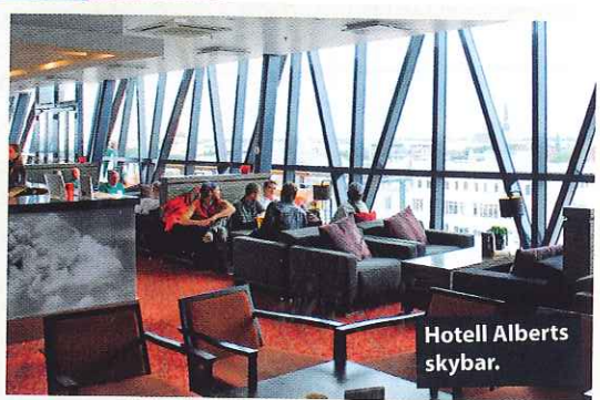
Hotell Alberts skybar.

och en självständighet som blev verklighet så sent som 1991 är staden en sagolik blandning av svenska, tyska och sovjetiska rötter – och optimistisk framtidstro. Efter flera hundra år av förtryck får man nu forma sitt eget land, och det görs miljardinvesteringar för att locka turister till Riga och Lettland. Såväl gourmanden som spafantasten och fashionistan kan numera få sina begär tillfredsställda här!