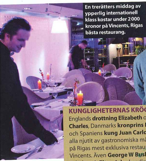
En trerätters middag av ypperlig internationell klass kostar under 2 000 kronor på Vincents, Rigas bästa restaurang.

KUNGLIGHETERNAS KRÖGARE Englands drottning Elizabeth och prins Charles, Danmarks kronprins Frederik och Spaniens kung Juan Carlos har alla njutit av gastronomiska mästarverk på Rigas mest exklusiva restaurang Vincents. Även George W Bush, Boris Jeltsin och Elton John har dinerat här.